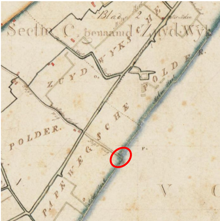
Kaart 01 in Sectie C

Papeweg in Sectie C genaamd Zuidwijk in de Papewegsche Polder. Op de grens met Voorschoten (zie rode ovaal) is het tolhuis gebouwd. Waarschijnlijk rond 1840.