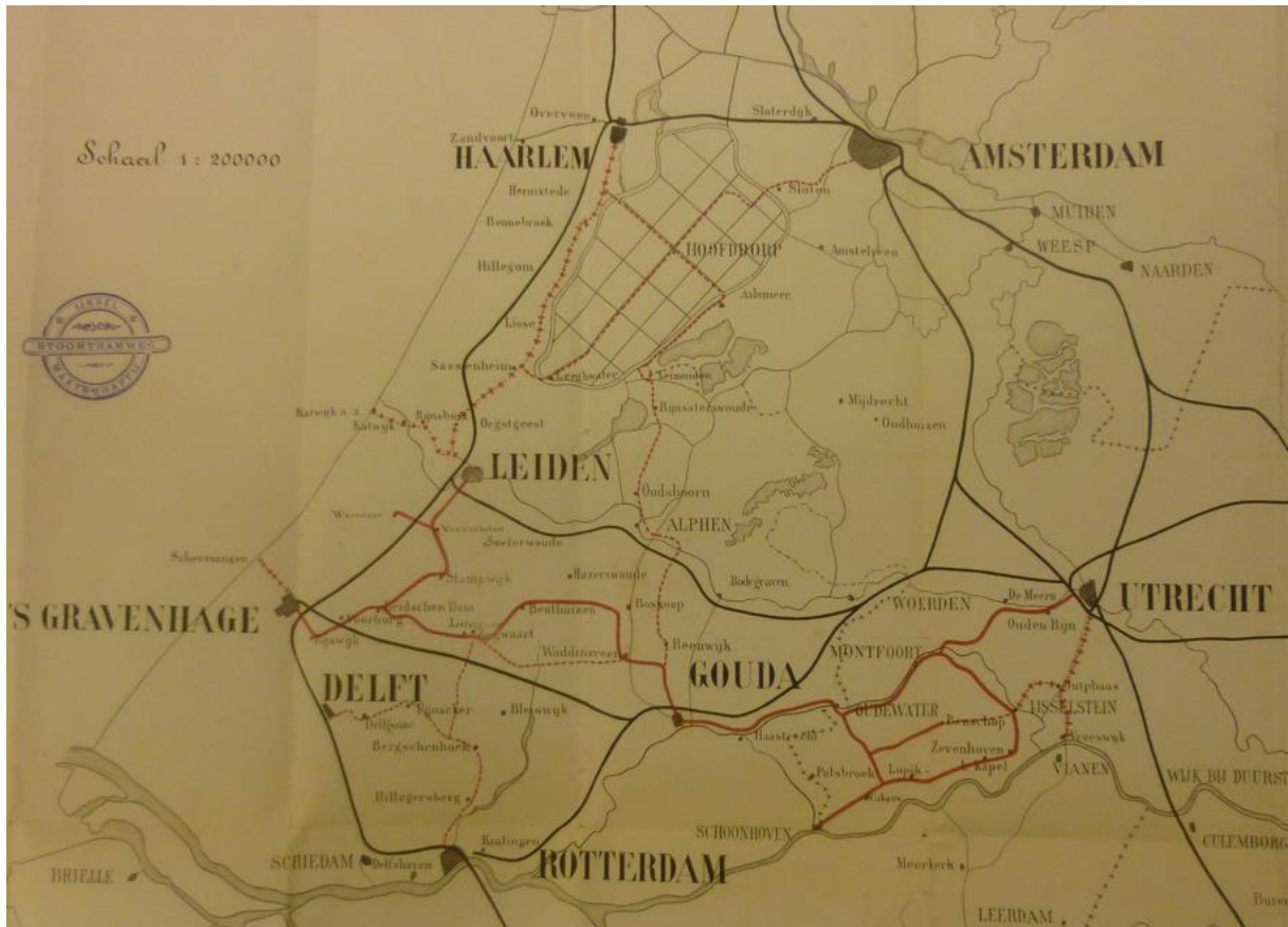
De "zijtak" Voorschoten – Wassenaar met de overige lijnen rond 's Gravenhage